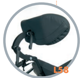
Appoggiatesta regolabile in rotazione e traslazione laterale