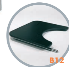
Tavolino in legno ribaltabile