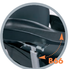
Bracciolo per emiplegico (su richiesta)