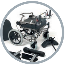
Facile da trasportare