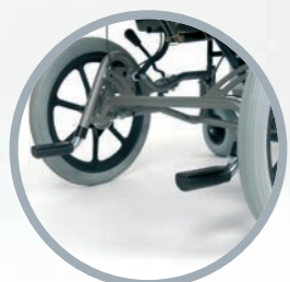
Due pedane posizionate nella parte posteriore favoriscono il superamento degli ostacoli