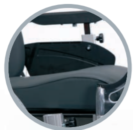
Braccioli estraibili, regolabili in altezza e larghezza. Sedile regolabile in profondità